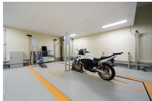
自動2輪が2台駐車できるトレー