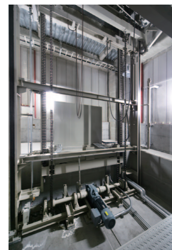
リフトピット部分