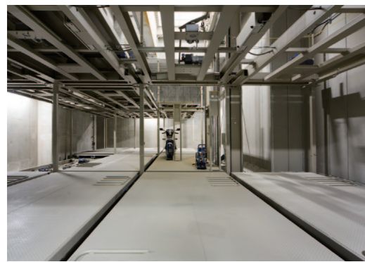
16台収容のコンパクト設計