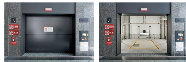
乗込み口正面(オートドア開閉時)