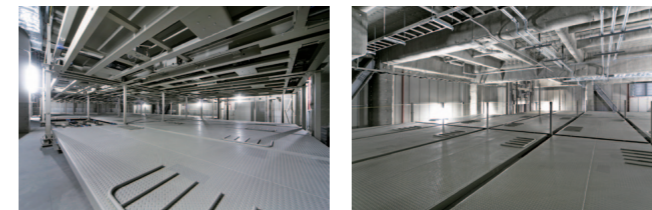
優れた平面効率で53台の収容を実現