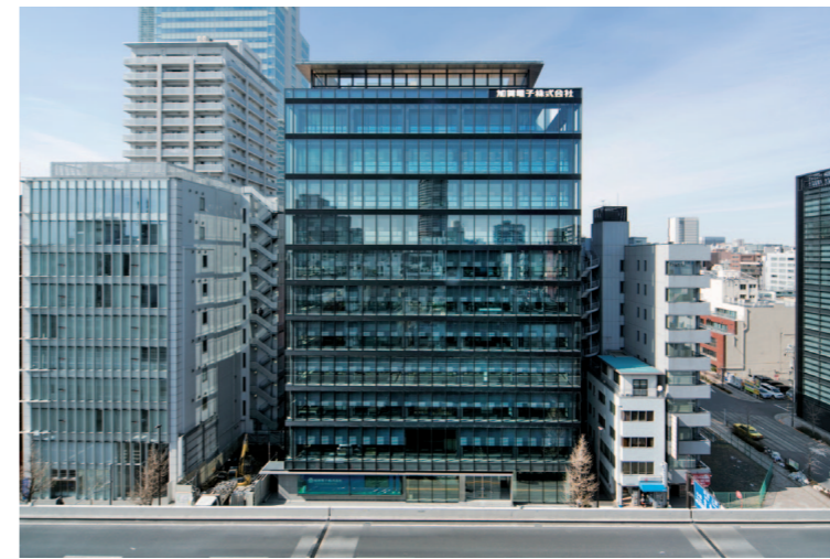
加賀電子本社ビル外観

そんな同ビルの駐車設備に選ばれたのが、日精の水平循環方式「フレキシブルパーク」です。秋葉原駅に程近い立地条件から限られた空間を有効活用でき、しかもターンテーブル内蔵でスピーディーな前進入出庫が可能な点が採用の決め手となりました。結果、優れた空間効率により、計53台の収納を実現。最先端のオフィスビルを実現する上で日精の先進技術が重要な役割を果たしました。