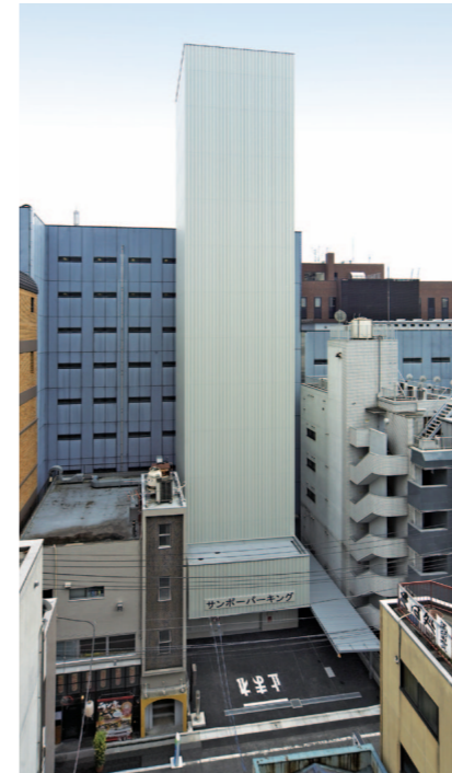
亀戸サンポーパーク外観

日精は効率的な工期のアレンジから、パーキングシステムの導入まで、機械式駐車場の設営にまつわる、すべての作業を一括しておまかせいただけます。