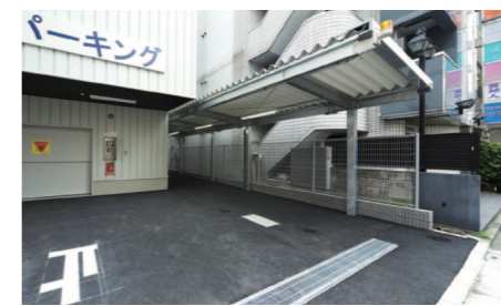
駐車場入り口の横にカーポートを設置