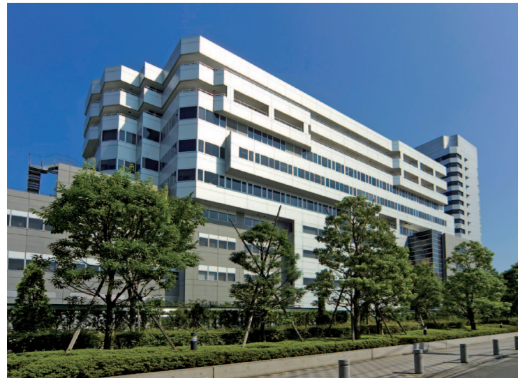
昭和大学病院外観

入庫車のサイズUPで稼働率が大幅アップ。さらに全車ミドルーフ車の対応も可能! 日精のリニューアルは、個別の問題点を解決し、さらなる利便性の向上を実現します。