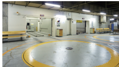
手前がリニューアル後の乗り込み口

【建築・駐車設備概要】 【建築主】学校法人 昭和大学 【監理】フジバスク(株) 【施工】日精(株) 【機種】LEVELパーク(水平循環方式) 【型式】NLPLSR2C-10B1FD 【収容台数】22台