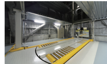
スムーズな入出庫を可能にするエレベータ方式フォーク式